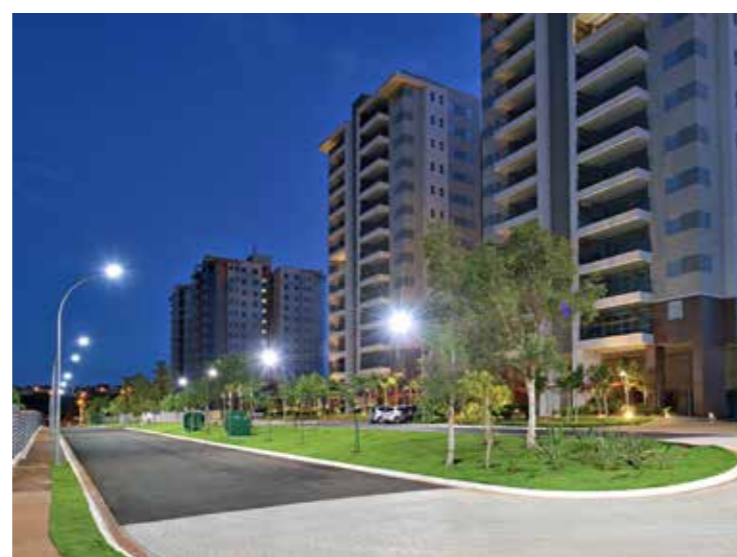
Nas imagens acima, o foco é o projeto arquitetônico que contempla tanto o paisagismo como as formas limpas e contemporâneas que marcam o empreendimento