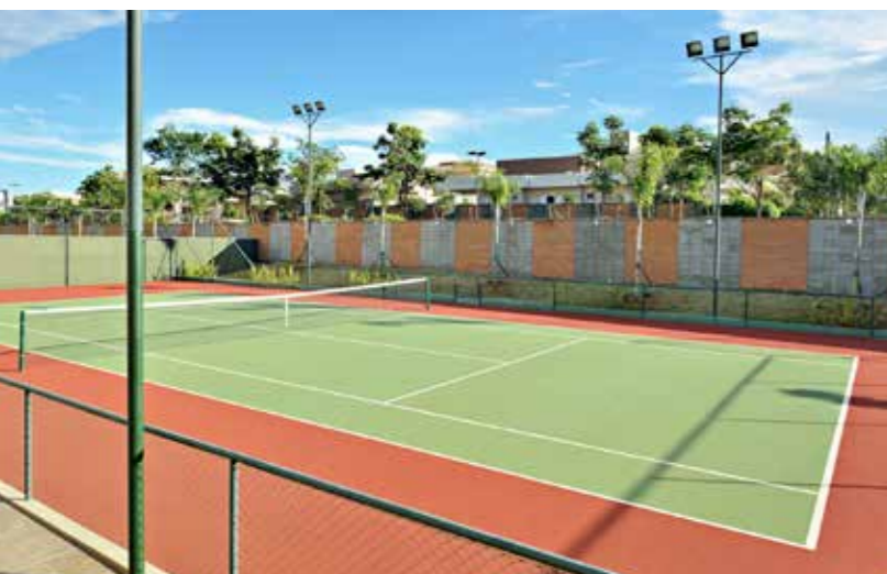
Na página anterior, à esquerda, vista geral do Bellegarde, Hall de acesso e lobby. À direita, perspectiva do empreendimento e área da piscina. Nesta página, acima, o complexo de prédios cercado pelo centro de fitness, quadra de tênis e pista para caminhada. Ao lado, detalhes da academia