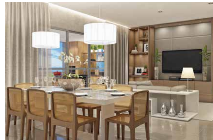
Perspectiva da varanda gourmet e do living. Ao lado, fachada do prédio

Conforto e requinte não foram poupados. Cada apartamento terá três dormitórios (incluindo uma suíte) e duas vagas na garagem, além de comodidades sociais como fitness center, duas piscinas, playground, quadra, churrasqueira gourmet e sauna. Outro ponto atraente é a flexibilidade do