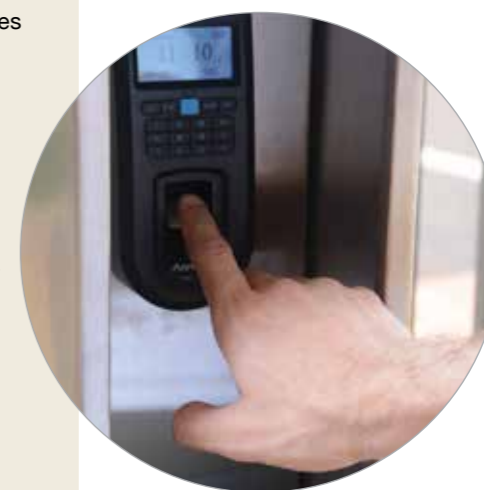
À esquerda, modelo de fechadura biométrica e com sistema digital disponível no mercado. Nesta página, circuito interno do condomínio Les Alpes e detalhe do funcionamento dos equipamentos implantados no empreendimento