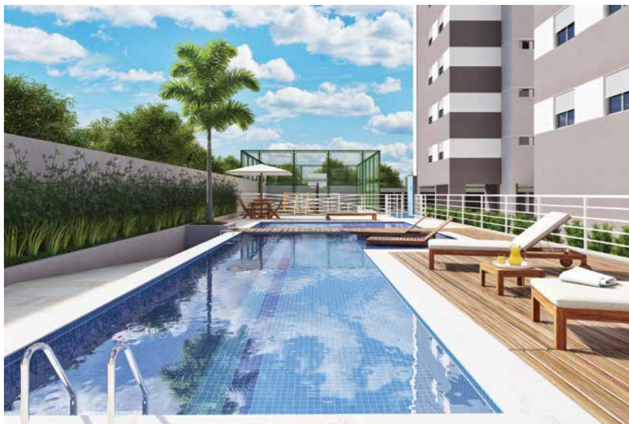
Nesta página, área social e piscina do empreendimento. À direita, área de lazer para as crianças e planta com destaques do projeto