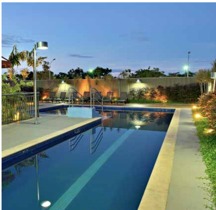
Acima, espaço gourmet com forno de pizza e churrasqueira, piscina com raia, quadra de squash, salão de jogos, espaço kids e spa

em quatro torres residenciais (Bellegarde, Bellevue, Beaumont e Beausoleil), cada uma com 12 pavimentos, apartamentos de 140 metros quadrados e ambientes de lazer independentes administrados por uma associação interna, que tem ainda a função de coordenar tarefas como a limpeza e a segurança do condomínio, detalhe que reduz o valor mensal das unidades com as taxas de manutenção, mas sem abrir mão da qualidade dos serviços prestados, a exemplo da monitorização integrada por 60 câmeras que funcionam 24 horas por dia. De olho nas demandas atuais, o Les Alpes ainda oferece quadra de tênis, squash, sauna com spa e ducha externa, lounge, sala de jogos, recreação kids, academia de ginástica com equipamentos de ponta e recintos dedicados para as práticas de ioga, dança e spinning. Desde dezembro de 2014, a Copema iniciou a entrega das chaves aos moradores da torre Les Alpes Bellegarde. ■ Les Alpes Bellegarde, Avenida Aparecido Savegnago, 140.