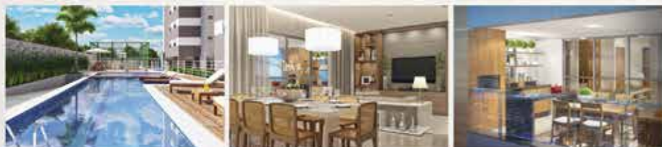
Perspectiva artística da Piscina.