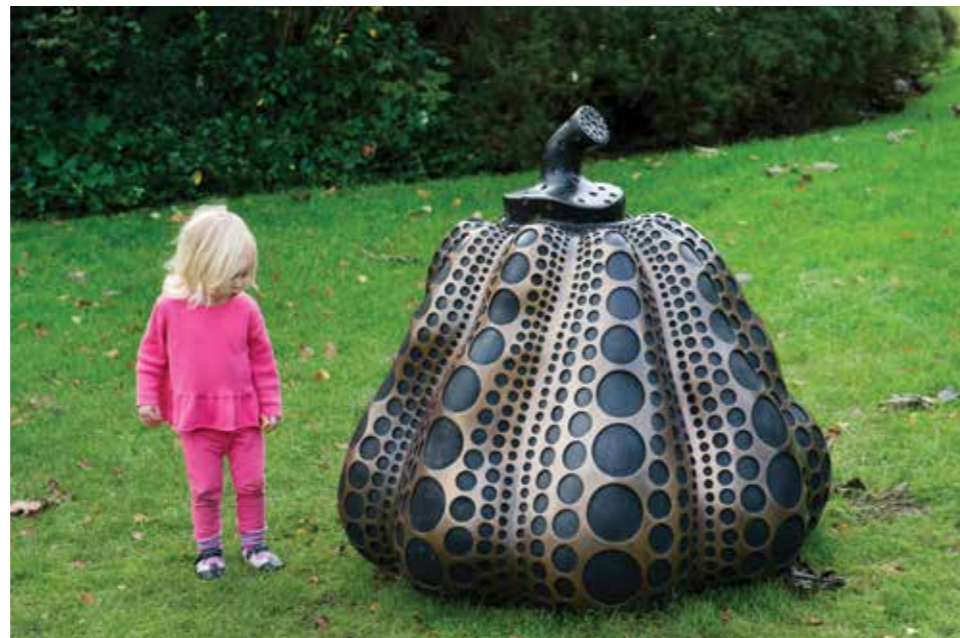
Nesta página, entrada da Frieze Art Fair e obra de Yayoi Kusama no Parque de Esculturas de Frieze. À direita, Jardin des Tuileries com a escultura Small Nomad House project, de Sou Fujimoto. Mais abaixo, na Art Basel, filmes são projetados em uma parede de 7.000 m 2 , ao ar livre, no SoundScape Park