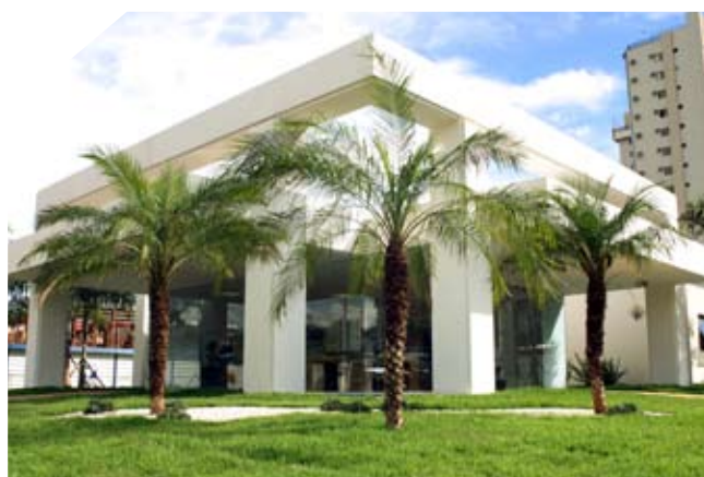
Plantão de vendas na Avenida Maurílio Biagi