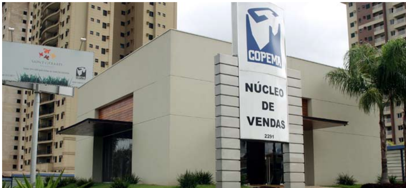
Plantão de Vendas da Av. Prof. João Fiusa

Todos os dias da semana, a pessoa interessada em conhecer ou adquirir um imóvel da Copema pode ligar na empresa ou nos núcleos de vendas. As equipes estão preparadas e sempre prontas para apresentar o que há de melhor e mais atraente no mercado imobiliário.