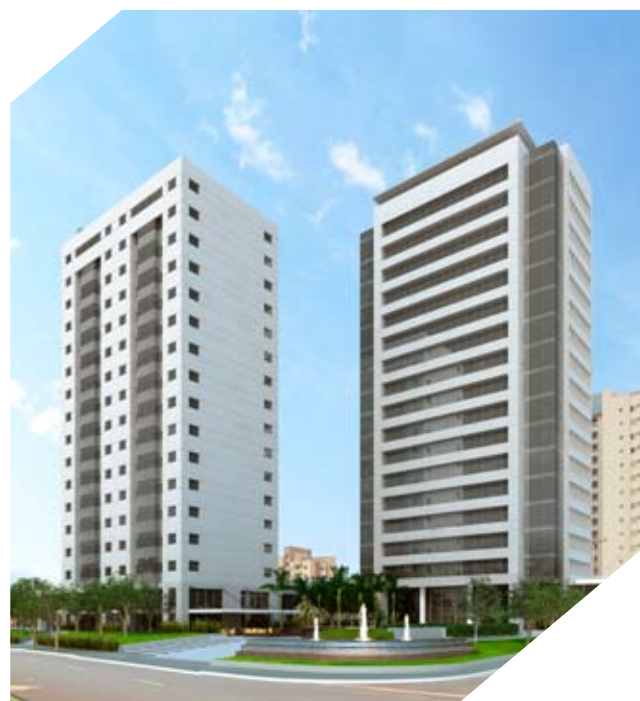
Projeto arquitetônico do Spasse é da Konigsberger Vannucchi

O projeto moderno, as instalações funcionais e a localização privilegiada do Spasse atraem empresas e escritórios que prezam pela qualidade de vida e que buscam sofisticação e otimização de espaço em seus ambientes de trabalho.