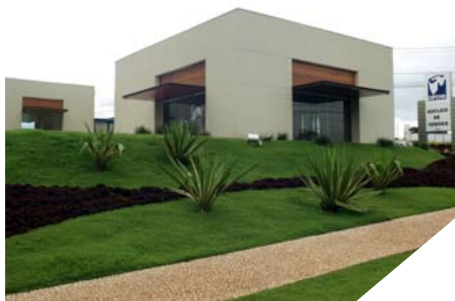
Plantão de Vendas da Av. Prof. João Fiusa