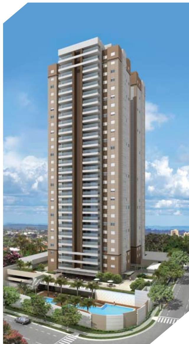
Perspectiva artística da fachada do Portes du Soleil

Além do Portes du Soleil, a parceria das duas empresas dará origem também ao complexo residencial Giardino, localizado no bairro Nova Aliança. O empreendimento com mais de 36 mil metros quadrados será dividido em quatro condomínios - Solare, Terrae, Botanic e Vereda - com um total de dez torres de 14 andares e apartamentos de 2, 3 e 4 dormitórios.