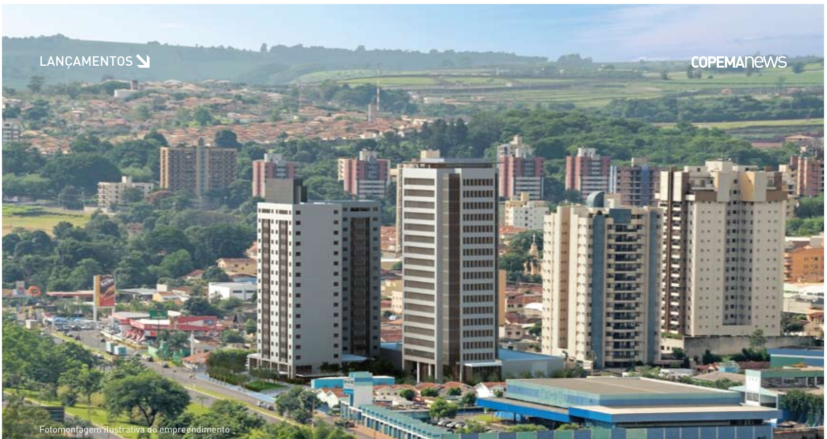
Fotomontagem ilustrativa do empreendimento