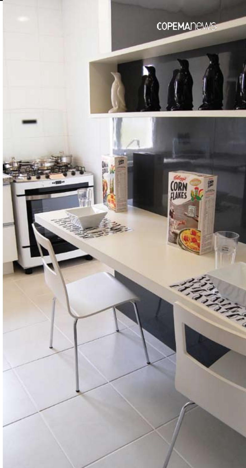
Apartamento decorado - Giardino

A profissional é enfática quando o assunto é bem-estar: apesar da sala ser o ambiente mais visitado da casa, é essencial que tenha a cara do dono, que precisa se sentir confortável ao entrar na própria residência. Mas, para isso, é necessário estar aberto ao novo. Muitas vezes, ao mudar para uma nova moradia, muitas famílias não conseguem se livrar da antiga mobília e isso pode se tornar um grande problema. “Os apartamentos são diferentes e existem móveis que se encaixam em alguns lugares, mas não combinam em outros. Sempre é