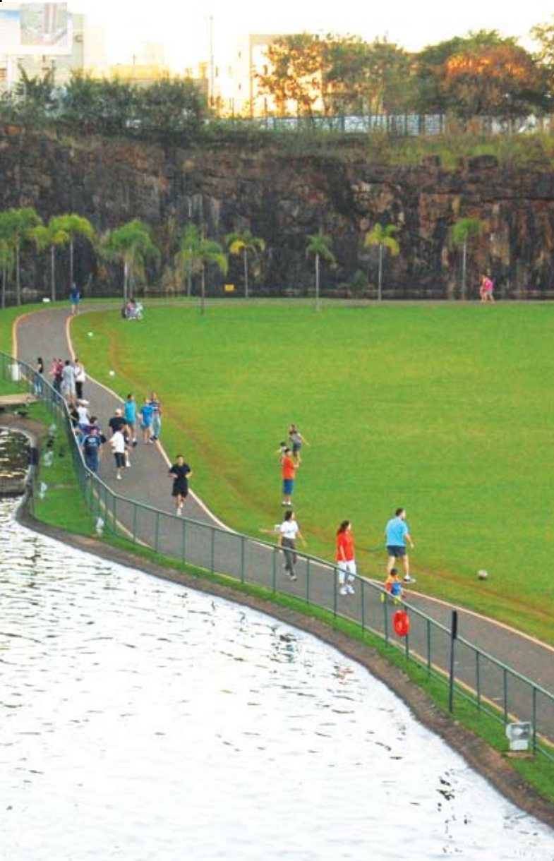
Parque Carlos Raya

a padarias, farmácias, bancas de revistas, ambientes que tornem o bairro uma comunidade. “Não é só uma questão de abastecimento, é um lugar de encontro, você faz amigos na padaria, fica sabendo das fofocas na farmácia e na escolinha de judô. Esse tipo de coisa fomenta a vida na escala da vizinhança, você começa a criar laços das pessoas que moram naquele lugar com o local onde vivem, criando assim uma comunidade, o que aumenta a segurança, o bem estar psicológico das pessoas”, explica.