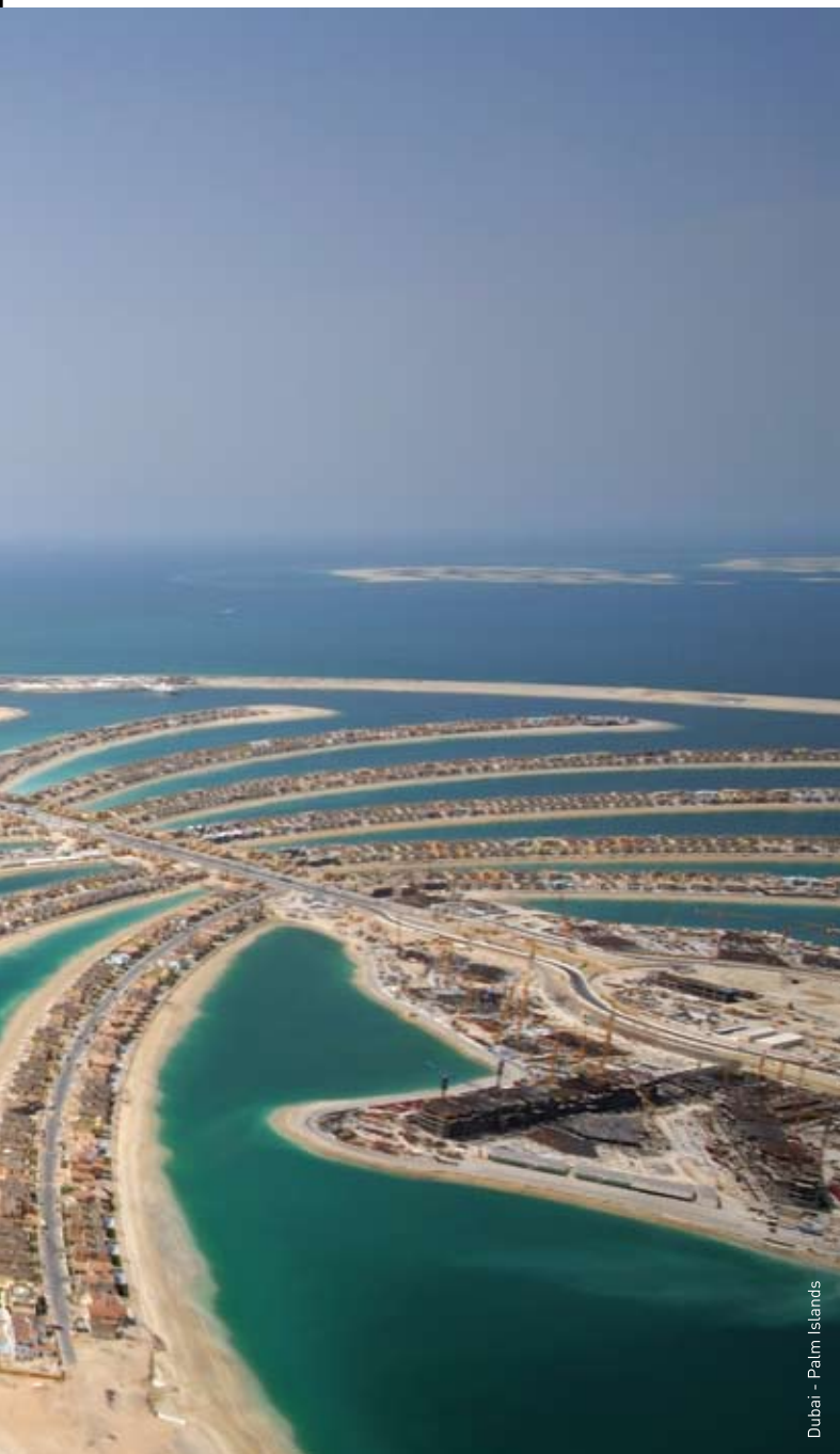
Dubai - Palm Islands