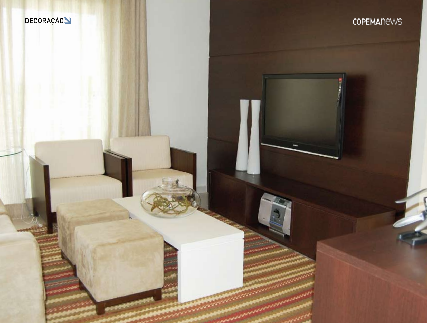
Apartamento decorado - Giardino

na sala, como tapetes, espelhos e luminárias. Segundo a arquiteta, esses adornos, se trabalhados de forma equilibrada, podem dar mais vazão aos ambientes. Os espelhos, por exemplo, dão a impressão de uma sala maior, pois dobram a profundidade dos cômodos. O ideal é que eles reflitam imagens ou objetos como quadros, vasos ou detalhes interessantes do ambiente. Os tapetes ajudam a delimitar áreas. São eles que demarcam e impõem os limites dos ambientes. Outro adorno importante para a otimização dos espaços numa sala são as paredes. Com a diminuição do tamanho dos cômodos, as divisórias acabaram desempenhando um papel importante. Em muitos casos, recebem adesivos, apoiam mobílias e enfeites. Já as luminárias perdem um pouco de destaque. Elas passam a ser embutidas no teto das casas.