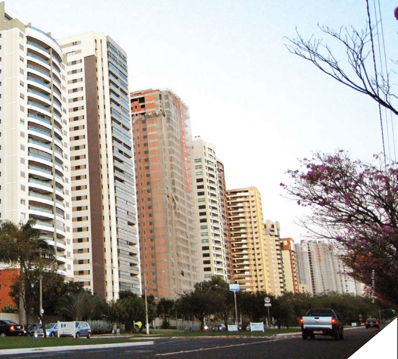
Av. Prof. João Filusa

O crescimento desordenado das cidades torna cada vez mais frequente o planejamento do local ideal para se viver. Desde a primeira revolução industrial, quando os municípios começaram a crescer, os dirigentes, médicos e engenheiros notaram que a ocupação de um espaço sem planejamento gera condições insalubres e desperdício de energia, ou seja, é preciso haver uma base muito bem estruturada.